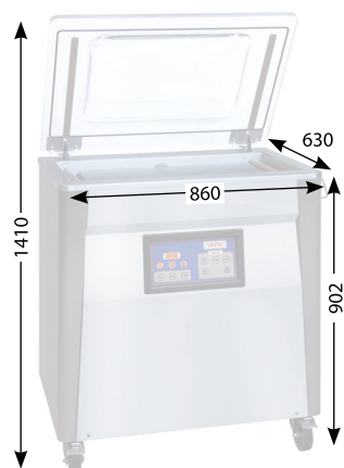
Außenmaße (mm) Outer dimensions (mm) Cotes extérieures (mm)